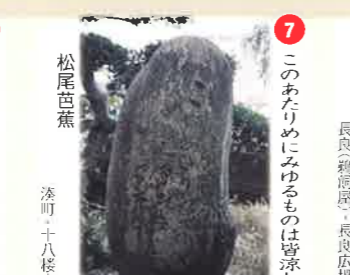
⑦ このあたりにみゆるものは皆涼し 松尾芭蕉 漆町 十八楼内