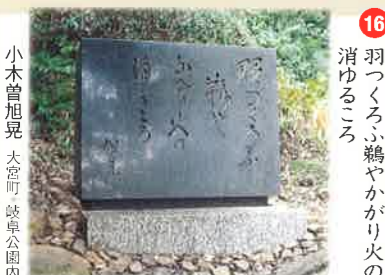
⑬ 羽つくろふ鶴やかかり火の 消ゆるころ 三浦樽良 大宮町 岐阜公園内