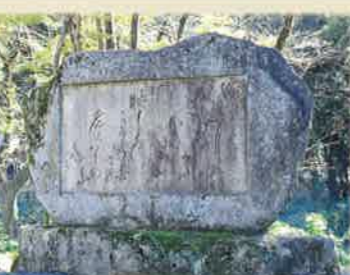
㉒ 正史にはありとも風の涙落つ 松尾芭蕉 伊奈波神社境内