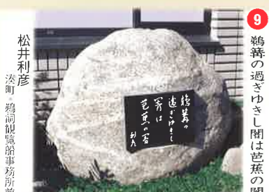
⑨ 鶴養の過ぎゆきし闇は芭蕉の闇 松井利彦 漆町 鶴飼観覧船事務所前