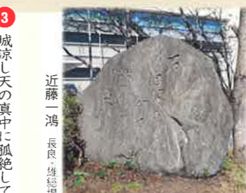
② 石見ゆる間に鶴のかげ走りけり 近藤一鴻 長良 雄雄碑