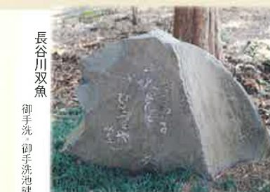
⑯ すゞめの子一尺とてひとつたや 長谷川双魚 御手洗 御手洗池畔