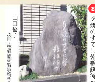
⑧ 夕焼のすてに紫鶴飼待つ 山口誓子 漆町 鶴飼観覧船事務所前