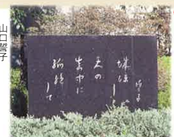
③ 城涼し天の真中に孤絶して 山口誓子 長良 岐阜ランドホテル正門