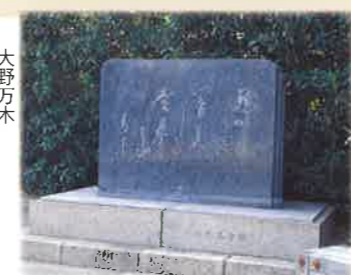
⑥ 鶴かマリや閑美しき金華山 大野万木 長良(鶴飼屋) 長良広場