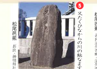
⑤ 又たくひなからの川の鮎なます 松尾芭蕉 長良 神明神社