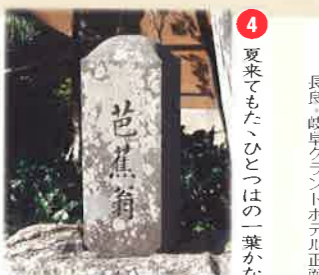
④ 夏来てまた、ひとつはの葉かな 松尾芭蕉 長良 法久寺 法久寺