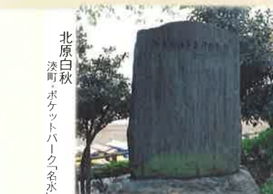
⑫ 蕪火の朱にはゆる君こそは 鶴匠なれ 濡れしつゝ腰蓑の風折鳥 帽子古風にて すばやくも手にさばく 時の間よはらに 香魚を追ふ鶴の数のつきつきと 目にはへは はうはつと呼ぶこゝの誰ならず 夜を惜しむなり 北原白秋 漆町 ポケットパーク名水