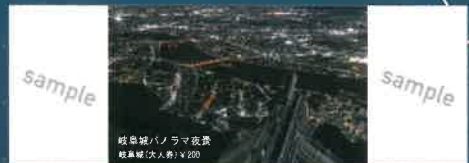
岐阜城パノラマ夜景 岐阜城(大人券) ¥200