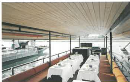
（写真は全てイメージ）