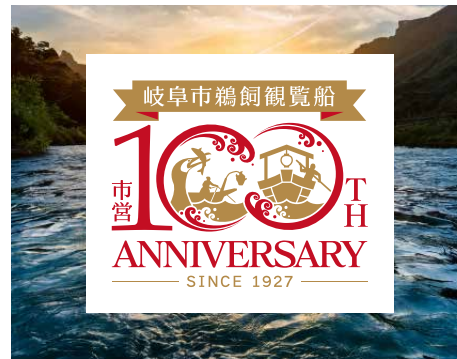
写真背景/カラーロゴ①(白マドあり)