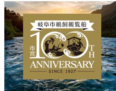
写真背景/カラーロゴ②