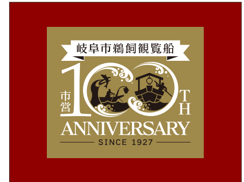
濃い背景/カラーロゴ②