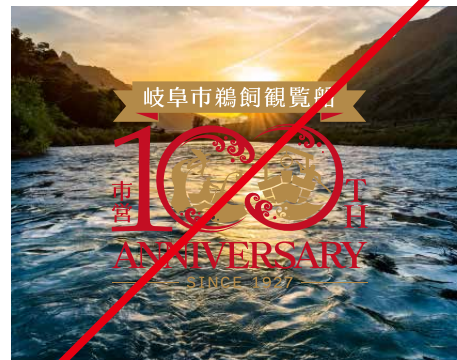
写真背景/変化の多い絵や写真の上でカラーロゴ①は使用しない