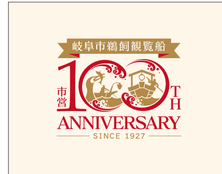
薄い背景(トータルインキ量15%まで)/カラーロゴ①