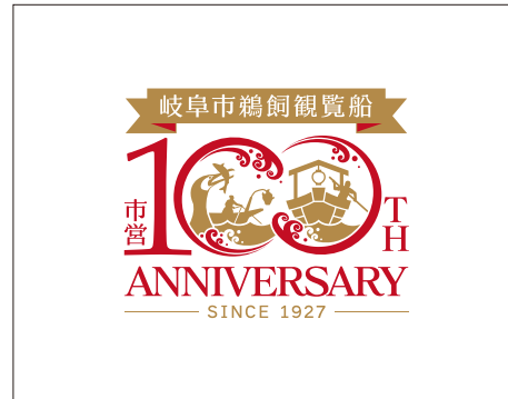
白背景/カラーロゴ①