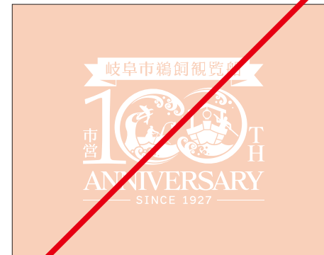
薄い背景での白抜きロゴは使用しない